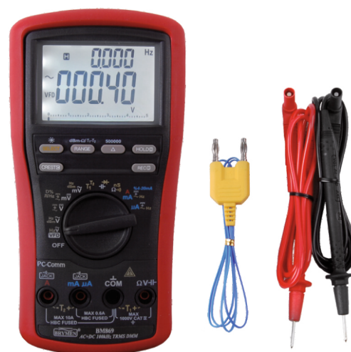
BM 869s z wyposażeniem standardowym