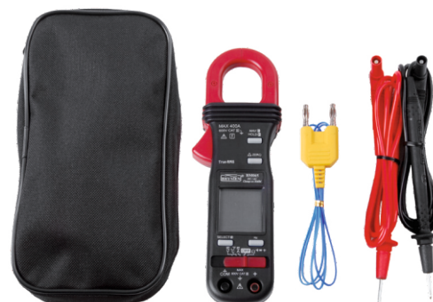
BM 065s z wyposażeniem standardowym