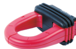
Wysmukłe cęgi miernika BM 065s