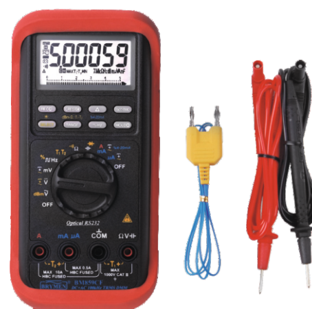
BM 859s z wyposażeniem standardowym