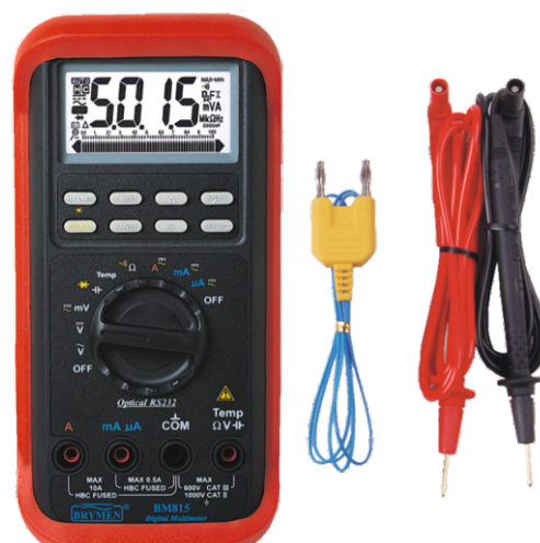
BM 815s z wyposażeniem standardowym