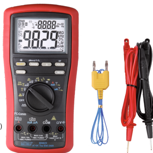
BM 829s z wyposażeniem standardowym