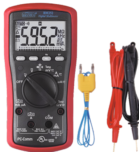
BM 252s z wyposażeniem standardowym