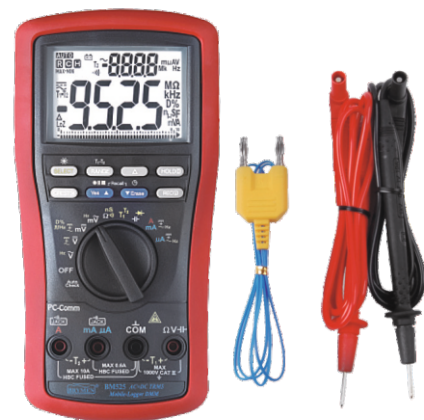
BM 525s z wyposażeniem standardowym