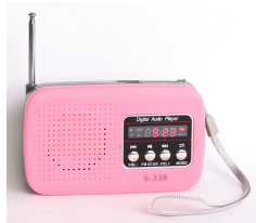
Mini radio, zasilanie USB 5V, akumulator NiCd