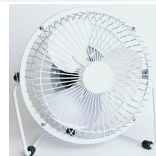
Wentylator, zasilanie USB 5V