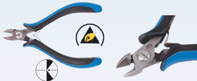
RG 95R Nr kat. 311104