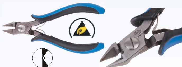
RG A100R Nr kat. 311102