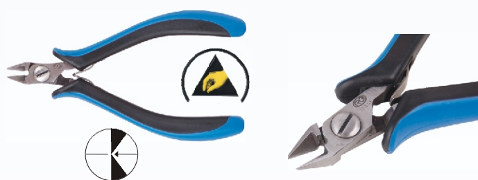
RG A90R Nr kat. 311103