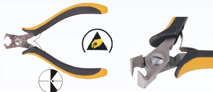
RG HM18 Nr kat. 311107