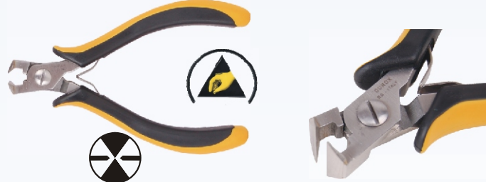
RG HM316S Nr kat. 311106