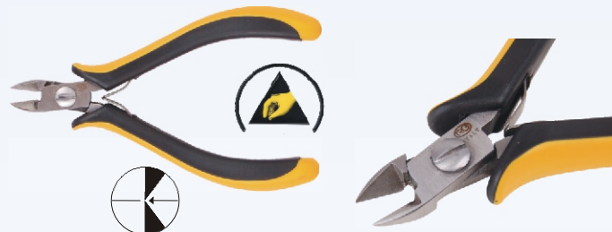
RG HM201 Nr kat. 311105