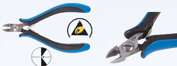
RG 90R Nr kat. 311101