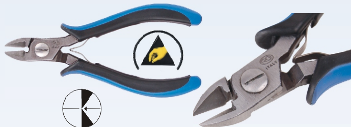
RG 100R Nr kat. 311100