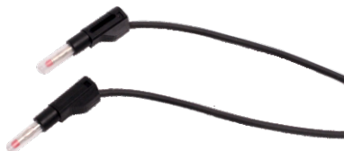
Nr kat. 105066