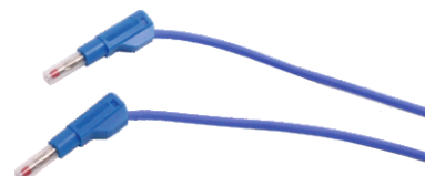
Nr kat. 105067