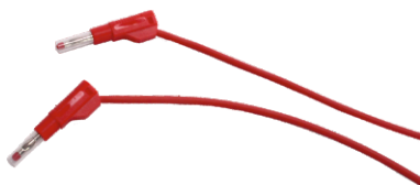
Nr kat. 105065