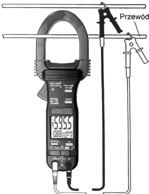
Rys. 11. Sposób pomiaru mocy miernikiem BM155

Wszystkie modele tej serii mają funkcje: AutoVA i zapamiętania wartości szczytowej prądu i napięcia przemiennego (PIK-rms HOLD) z czasem odpowiedzi 65 ms. Mierniki BM152 i BM155 dodatkowo mierzą temperaturę i mają podświetlane wyświetlacze. BM155 wyposażony jest ponadto w funkcję THD%-F. Funkcja ta wylicza współczynnik zawartości harmonicznnych w mierzonej instalacji do 51 harmonicznej w sposób zgodny z wytycznymi normy PN-EN 50160 określającej zasady pomiaru wskaźników jakości energii. Dzięki temu miernikiem BM155 można w prosty sposób sprawdzić jakość energii elektrycznej w mierzonej instalacji co do tego parametru.