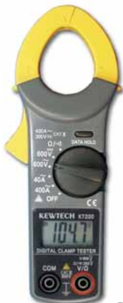
Rys. 6. KT200

CHY9001 to najnowsza konstrukcja firmy CHY umożliwiająca pomiary w instalacjach Kat III 1000 V (EN 61010-1) i z ochroną na przeciążenie wejść pomiarowych 600 V. Napięcia i prądy przemiennie mierzone są w paśmie 40-500Hz. Prąd