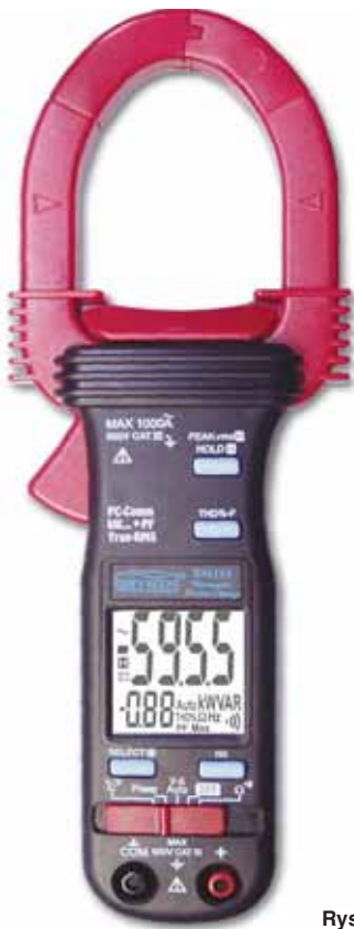
Rys. 9. BM155

1000 A z maksymalną rozdzielczością 0,1 A (najwyższy model BM118 True RMS mierzy prąd cęgami do 2000 A z maksymalną rozdzielczością 0,1 A i posiada dodatkowo funkcje Hz, EF, AutoCheck i Lo-Z).