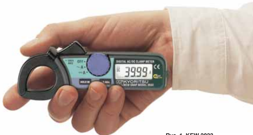
Rys. 1. KEW 2033

Wszystkie zaprezentowane w artykule urządzenia spełniają wymogi norm międzynarodowych, związanych z bezpieczeństwem i europejskimi dyrektywami 73/23/EEC (tzw. niskonapięciową) i 89/336/EEC (kompatybilności elektromagnetycznej).