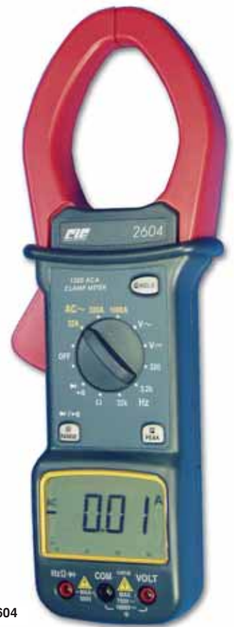
Rys. 12. CIE2604