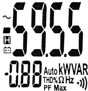
Rys. 10. Wyświetlacz miernika BM155

BM135 podobnie jak pozostałe modele serii 2. (BM131, BM132) mierzy prąd przemienny cęgami do 1000 A z maksymalną rozdzielczością 0,01 A. Mierniki tej