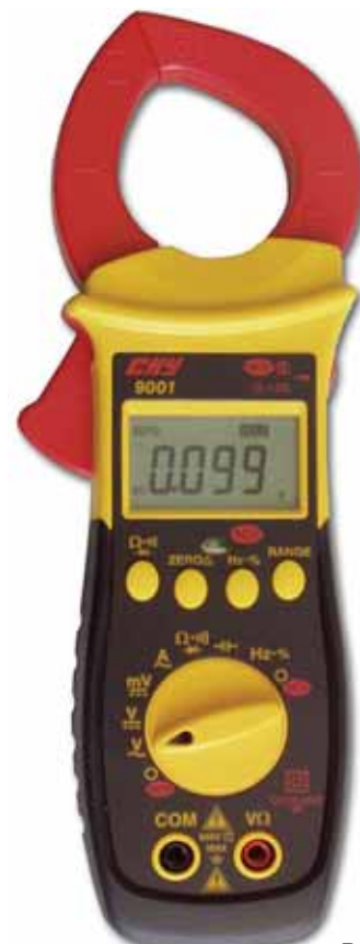
Rys. 8. CHY9001