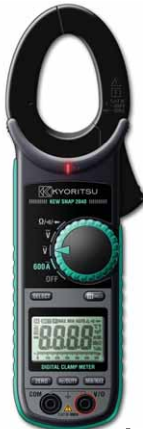
Rys. 7. KEW2040