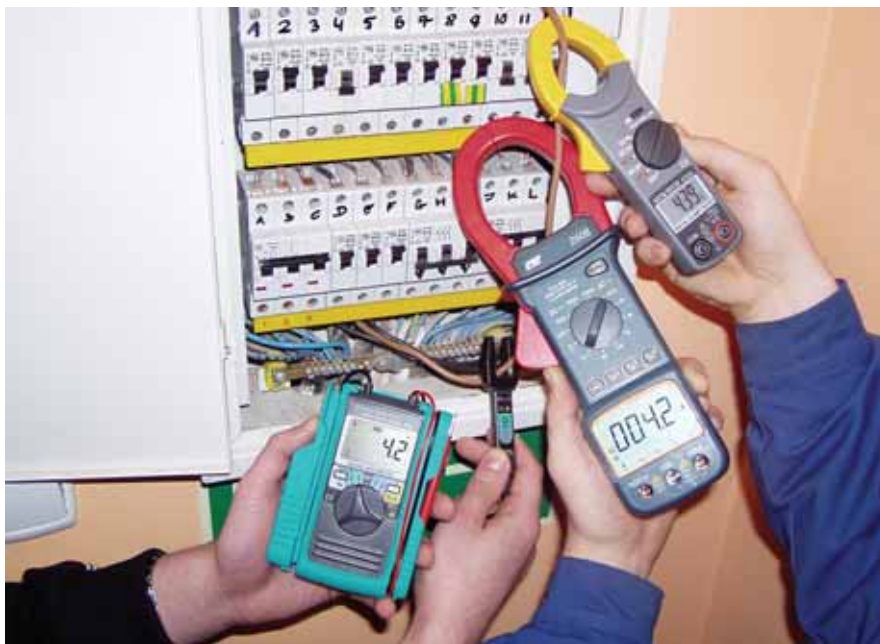
Rys. 2. KEWMATE200/2001, CIE2608 i KT203

Oprócz pomiaru prądu metodą cęgową mierniki tego typu wyposażone są zawsze w funkcje pomiarowe typowe dla multimetrów lub specjalne. Mierniki cęgowe z oferty Biall oferują nie tylko więcej z zakresu bezpieczeństwa pomiarów czy komfortu obsługi (np. AutoCheck, AutoVA), ale wprowadzają również wiele innowacji (Inrush Current Mode, Logger, THD%). W zależności od modelu charakteryzuje je przy tym wysoki stopień ochrony na przeciążenia, przepięcia i wytrzymałości elektrycznej.