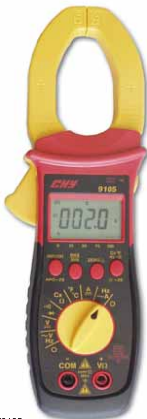
Rys. 4. CHY9105

KT203 łączy w sobie cechy wysokiej rozdzielczości (0,01A), stosunkowo wysokiego zakresu pomiaru prądów (400 A AC/DC) i maksymalnej średnicy przewodu 30 mm.