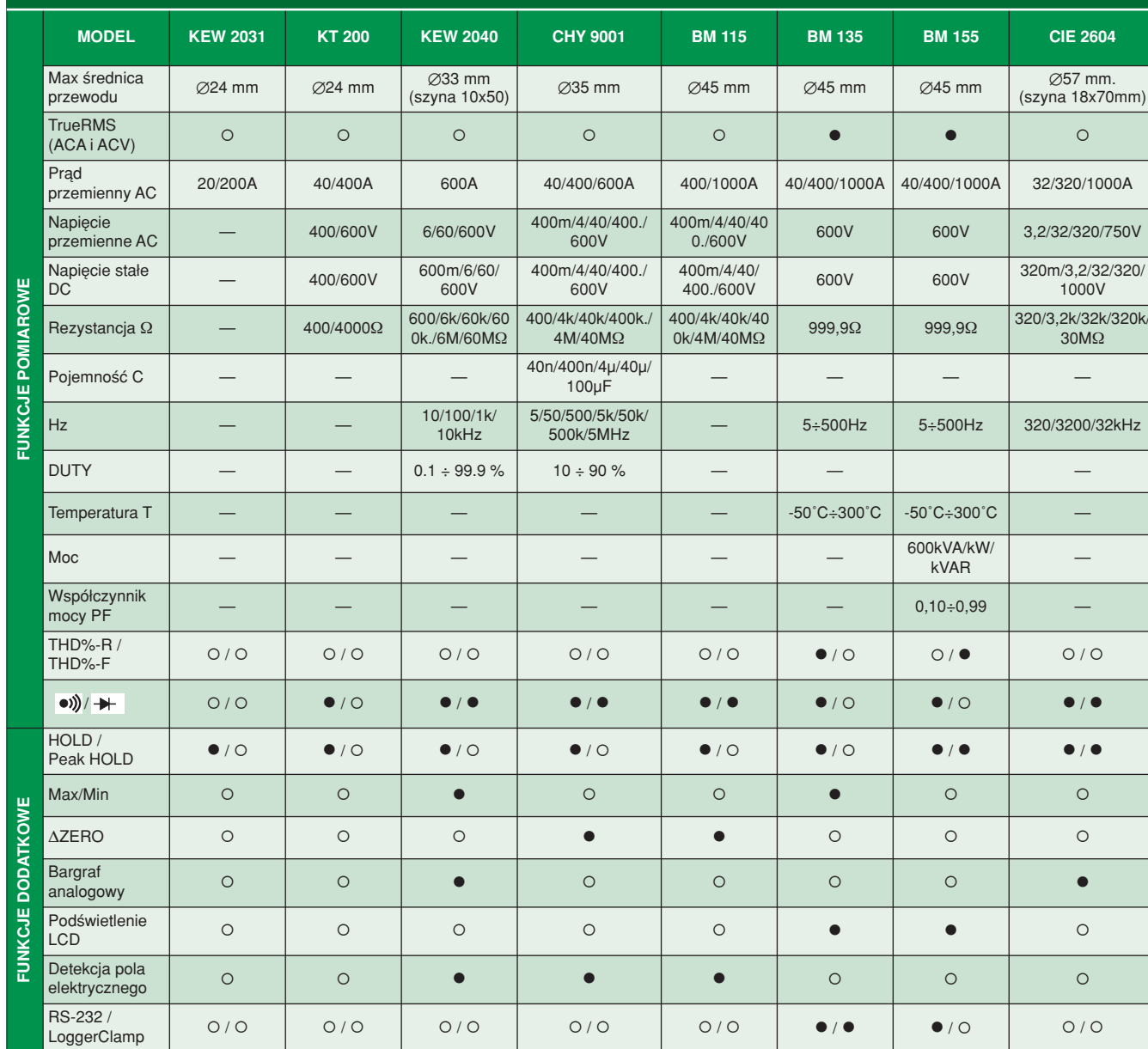
Tab. 2. Parametry wybranych mierników cęgowych AC

AC jest mierzony do 600 A z maksymalną rozdzielczością 0,01 A dla maksymalnych średnic przewodu 35 mm. Wyniki pomiarów są przedstawiane na podświetlanym wyświetlaczu cyfrowym LCD 3999 maks..