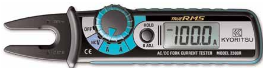
Rys. 3. KEW2300R

(dla średnic max 6mm) i do 100A (dla średnic max 10mm). „Widelki” pomiarowe są połączone z samym miernikiem elastycznym przewodem. Dzięki temu mierniki pozwalają na wygodne pomiary prądu w bardzo zagęszczonych wiązkach lub trudnodostępnych przewodach.