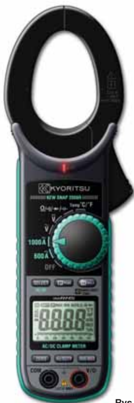
Rys. 5. KEW2056R