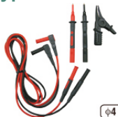
7122B przewody pomiarowe