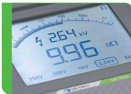
Duży ekran LCD