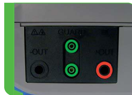
Zacisk GUARD eliminujący wpływ rezystancji powierzchniowej